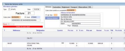
Saisie des factures